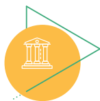
برنامه های فرهنگی

علاوه بر تحصیلات دانشگاهی از توسعه فرهنگی و حرفه ای دانشجویان نیز حمایت می شود