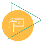
برنامه های سمینار با همکاری دانشگاه ها و سازمان های مردم نهاد

* بورسیه های پژوهشی شامل کمک هزینه ماهانه است